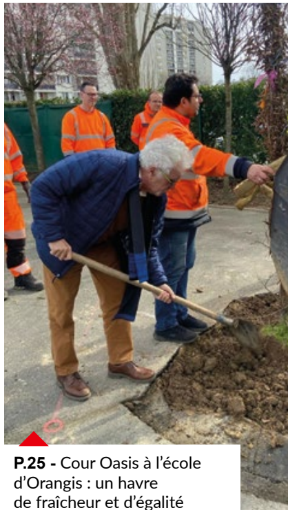
P.25 - Cour Oasis à l'école d'Orangis : un havre de fraîcheur et d'égalité