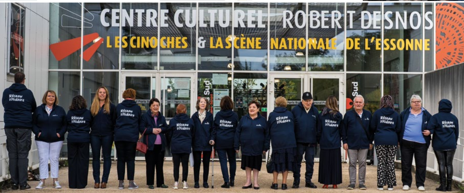
Inauguration de la Semaine Bleue des Retraités.