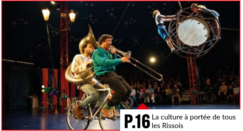
P.16 La culture à portée de tous les Rissois