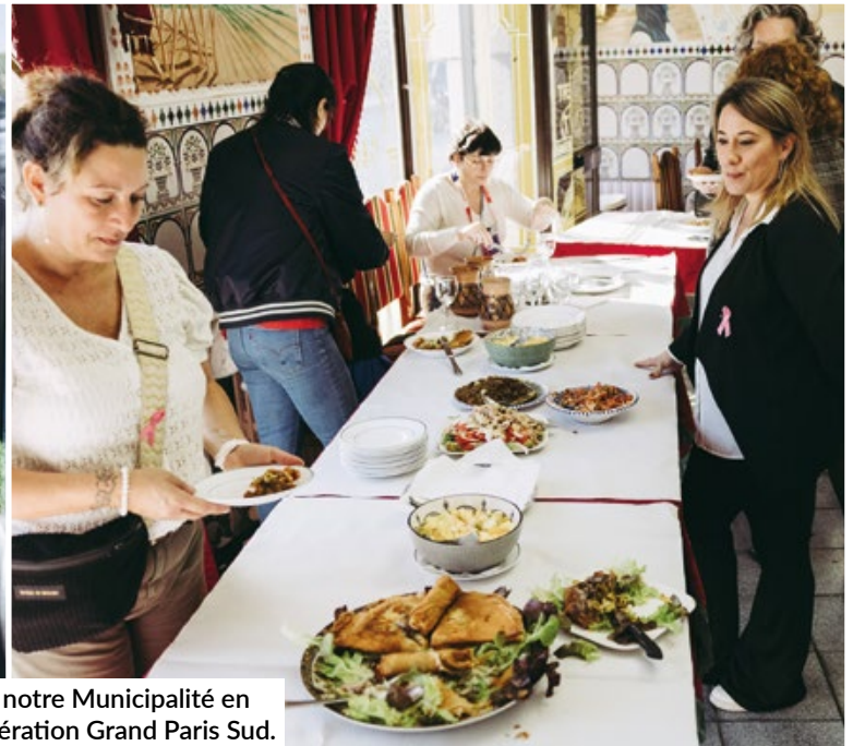
Balade culinaire organisée par notre Municipalité en partenariat avec notre agglomération Grand Paris Sud.