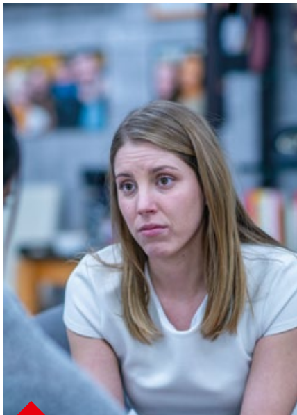
P.22 - 25 novembre, Journée internationale pour l'élimination de la violence à l'égard des femmes