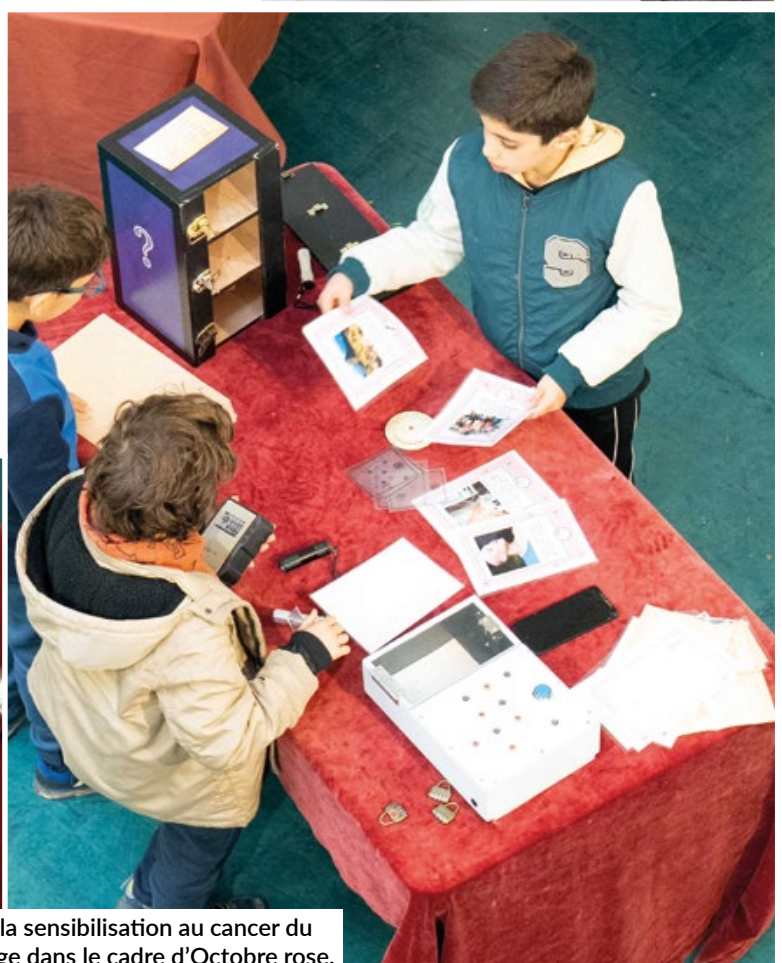
Escape game sur la sensibilisation au cancer du sein et le dépistage dans le cadre d'Octobre rose.