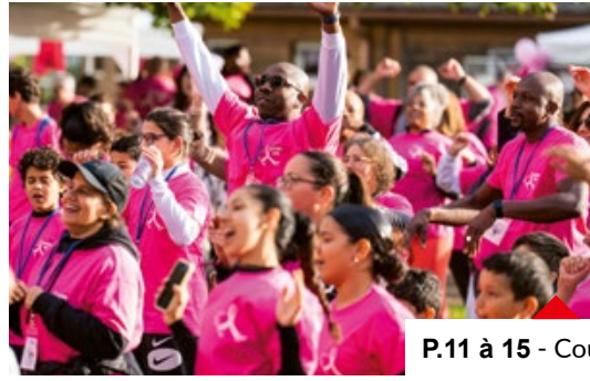
P.11 à 15 - Coup de projecteur